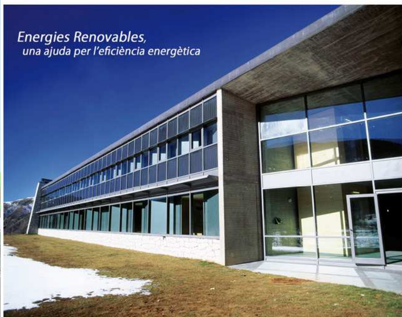
▲ Instal·lacions i control del Centre Natura de l'Obra Social de Caixa Catalunya

Energies Renovables, una ajuda per l'eficiència energètica